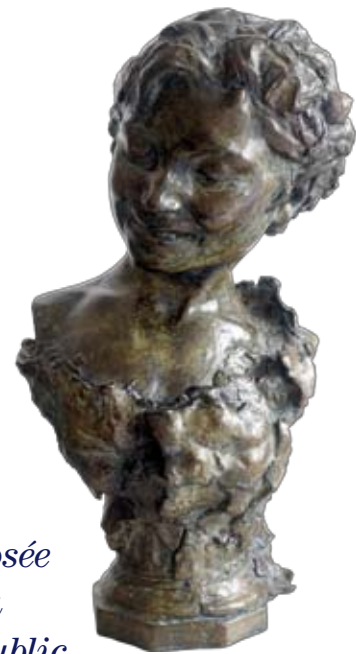
Faune rieur Bronze - Œuvre de Coquelin