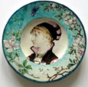
Portrait de Sarah Bernhardt Céramique « Lachenal »

Une Maison du Patrimoine correspond pleinement à la définition que donne d'un tel lieu le Code du Patrimoine :