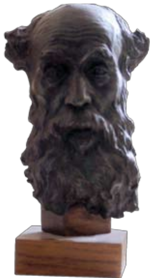
Bronze - Œuvre de Rodin

« Lieu où se trouve rassemblée toute collection permanente composée de biens dont la conservation et la préservation revêtent un intérêt public, et organisée en vue de la connaissance, de l'éducation et du plaisir du public. »