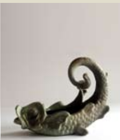
Pièce du service de table De Sarah Bernhardt Lachenal