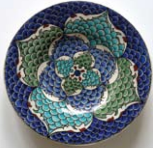
Décor Isnik Céramique « Lachenal »