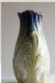
Luneville - Lachenal