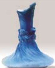
Les Nymphes Vase bleu - Lachenal

Il est indispensable que la Maison du Patrimoine soit un phare implanté dans un site prestigieux à forte référence historique.