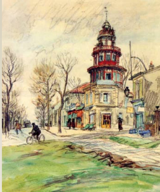
« Châtillon 1930 - le dancing de la "Tour Biret" Aquarelle - Eugène Véder

L'association des Amis du Vieux Châtillon a un rôle à jouer dans la vie de la cité. Elle a un rôle éducatif envers les enfants des écoles, un rôle de redécouvreur en tant qu'héritière de notre histoire que nous devons transmettre avec toute notre passion pour la faire partager.