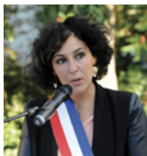
Nadège AZZAZ Maire de Châtillon Conseillère régionale