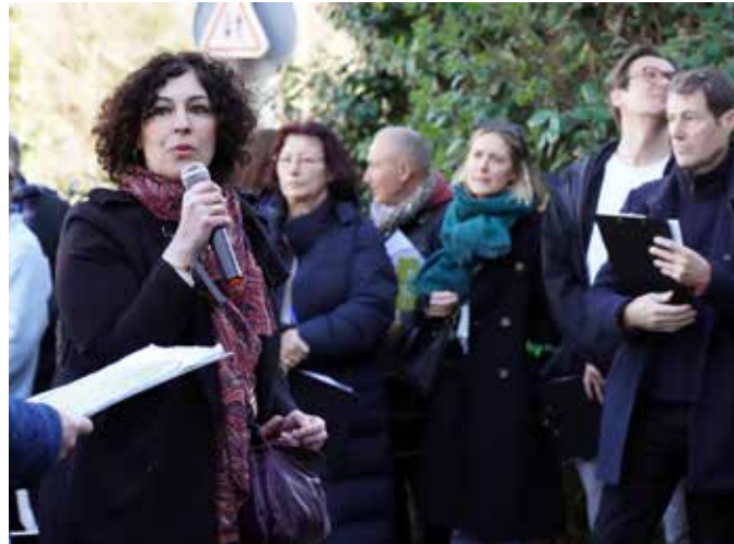
← Le projet d'éco-quartier sur la zone des Arues a fait l'objet de nombreuses concertations, comme ici lors d'une visite de terrain avec les habitants.

Tout d'abord, nous devrions voir l'arrivée du métro Grand Paris Express